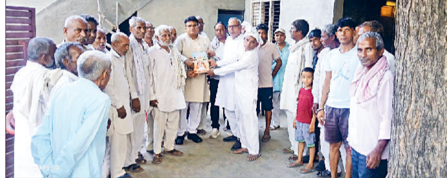
खरखौदा। समारोह के लिए निमंत्रित करते प्रसारक टीम।