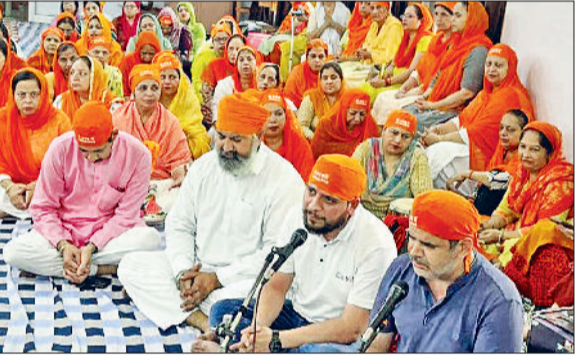
सोनीपत। प्रकाश दिवस उत्सव में हिस्सा लेते श्रद्धालुगण।