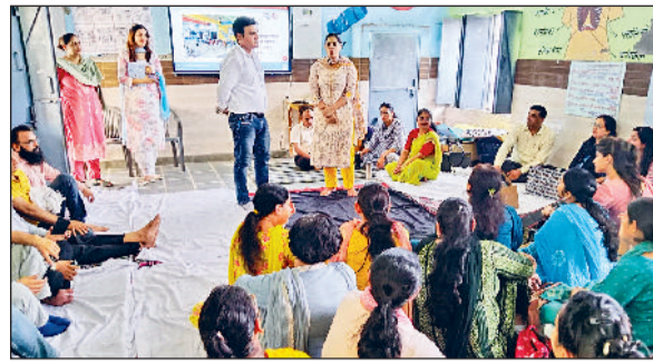
खरखौदा। प्रशिक्षण कार्यक्रम में भाग लेते अध्यापक।